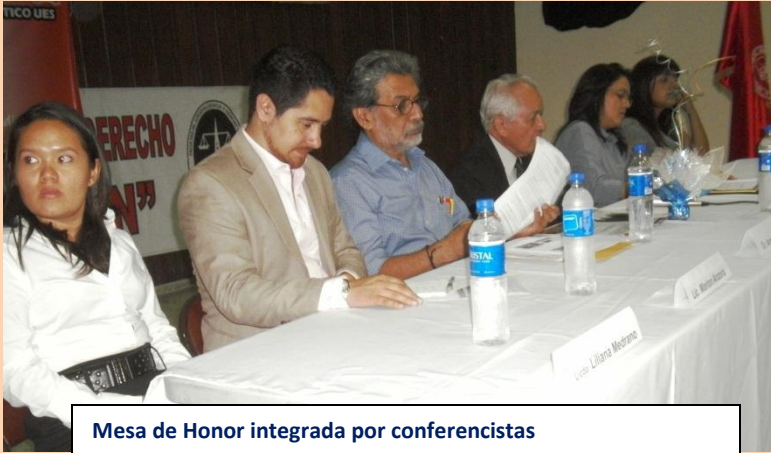
Mesa de Honor integrada por conferencistas