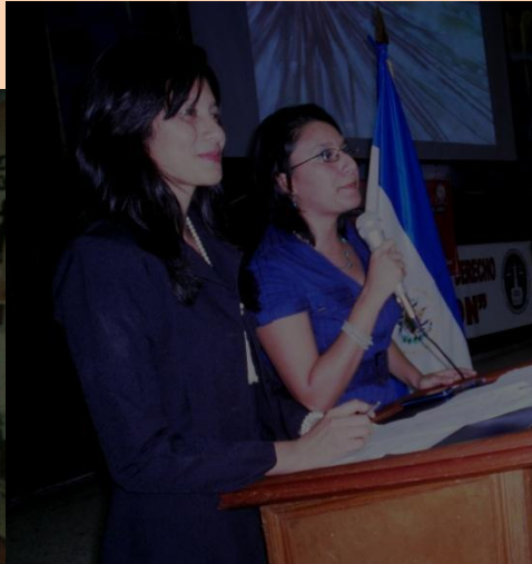
Maestras de ceremonia en el evento